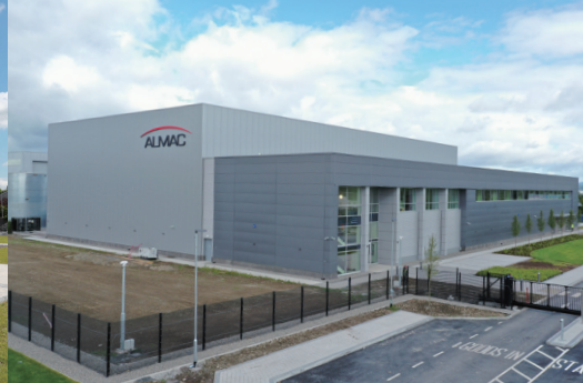
EU ディストリビューションセンター